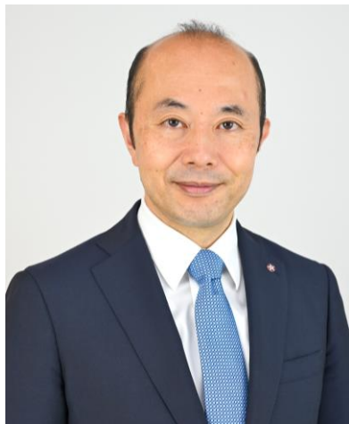
長崎市長 鈴木史朗

そのような中、利用者の皆様に、より一層長崎のまちをお楽しみいただける施設として、長崎ロープウェイの安全性向上に努めて参ります。